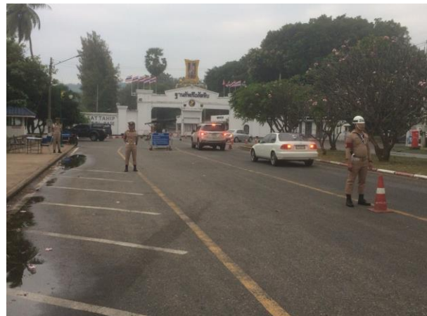
ขณะปฏิบัติหน้าที่กวดขันระเบียบวินัย